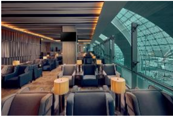
杜拜环亚机场贵宾室获投选世界旅游奖 “中东地区最佳机场贵宾室”