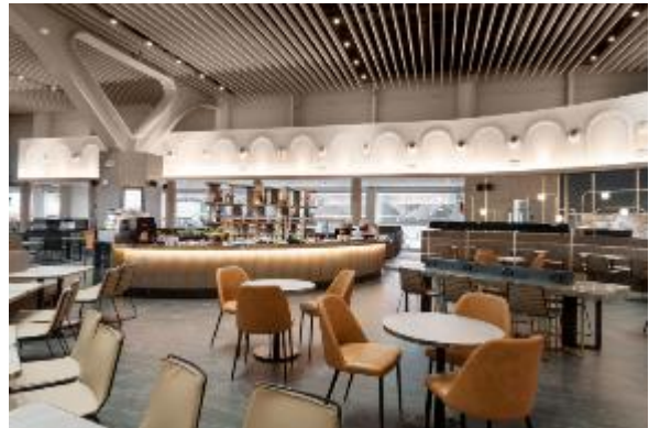
罗马环亚机场贵宾室获投选世界旅游奖 “欧洲最佳机场贵宾室”