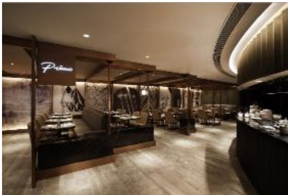
香港环亚优逸庭获投选亚太商旅奖“最佳独立机场贵宾室”