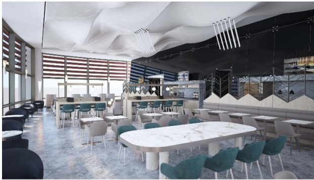
伊斯坦堡萨比哈格克琴国际机场环亚机场贵宾室设计理念

https://plaza-network.box.com/s/owt6g7rbymj082wtve5ljda964f03emr