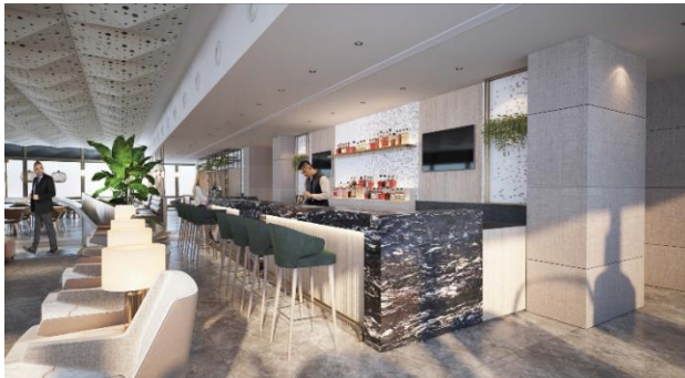
即将开幕的伊斯坦堡萨比哈格克琴国际机场国际离境大堂 环亚机场贵宾室